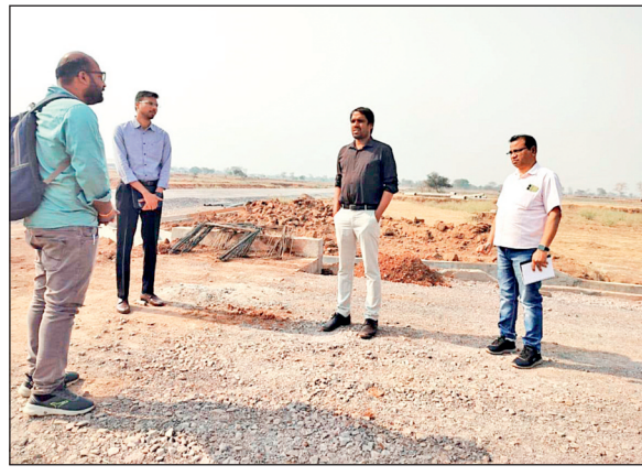
के उद्योगों को स्थापित करने के लिए छूट एवं अनुदान आदि सभी सुविधायें उपलब्ध कराई जाएंगी। औद्योगिक क्षेत्र में उद्यमियों को आवश्यकता अनुसार अलग-अलग आकार के 40 भूखण्ड उपलब्ध कराए जाएंगे। कलेक्टर ने औद्योगिक क्षेत्र में पानी की व्यवस्था सुनिश्चित करने के भी निर्देश अधिकारियों को दिए। उन्होंने पानी की उपलब्धता और नाली निर्माण का काम तेजी से करने को कहा। कलेक्टर ने परिसर में निर्माणाधीन पानी टंकी के काम का भी निरीक्षण किया। कलेक्टर ने पूरे परिसर में उद्योगों की जरूरतों के अनुसार बिजली

कलेक्टर ने औद्योगिक पार्क क्षेत्र में सड़क बनाने का काम पूरी गुणवत्ता से करने के निर्देश दिए। उन्होंने अधिकारियों को सड़क के काम में कोताही बरतने पर कड़ी कार्रवाई और लागत राशि वसूलने की भी सख्त हिदायत दी। उल्लेखनीय है कि राष्ट्रीय राजमार्ग के पास जी-जामगांव में लगभग 10 हेक्टेयर शासकीय भूमि पर सामान्य औद्योगिक क्षेत्र विकास का कार्य तेजी से किया जा रहा है। राज्य सरकार की औद्योगिक नीति के प्रावधानों के अनुसार इस क्षेत्र में विभिन्न प्रकार