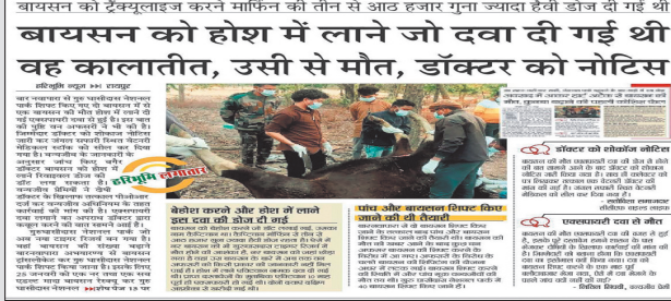
हिमालयन मालू की मौत भी लापरवाही का नतीजा : पिछले महीने नागालैंड जूलॉजिकल पार्क से जंगल सफारी के लिए हिमालयन मालू लाया जा रहा था, जिसकी सफारी पहुंचने से पहले रास्ते में मौत हो गई थी। उस मालू को लाने के समय मॉनिटरिंग डॉ. वर्मा कर रहे थे। सूत्रों के मुताबिक मालू को रास्ते में मृत्युमुखी सुविधाओं के साथ स्वास्थ्य परीक्षण नहीं मिल पाने की वजह से मालू की मौत हुई थी।